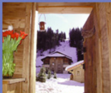
Vue du remonte-pente de notre porte

650 km de pistes balisées (et hors-pistes, si vous préférez) où vous pouvez skier librement sans un poste frontière en vue. Cela signifie un paysage différent chaque jour, si vous aimez la variété et la possibilité de pratiquer des pistes difficiles ou faciles. Vous pourrez profiter aussi d'une nature romantique, pour de courtes promenades à travers des forêts épaisses, ou grisante pour de longues promenades sur des chemins escarpés et étroits au-dessus et au-dessous de la ligne des arbres.